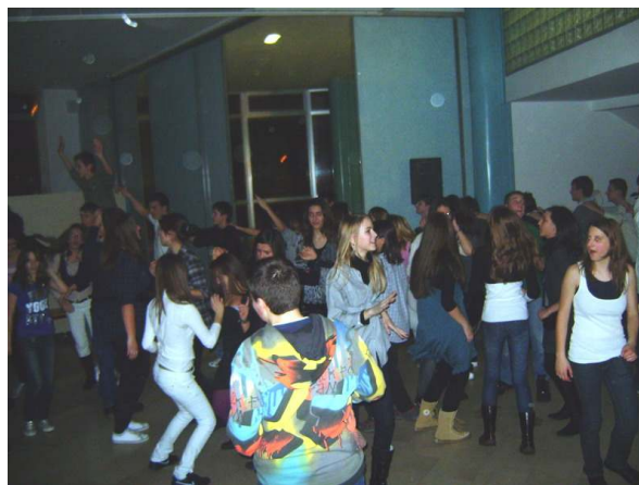
Djelić veselog ugođaja s plesa osmaša

11.02.2010. naši su osmaši obilježili Dan Sv. Valentina, zaštitnika zaljubljenih, uz Ples za Valentinovo, koji se održao u predvorju škole od 18 do 21 sat. Rasplesani i dobro raspoloženi, uz mnogo smijeha i zabave, cure i dečki plesali su na domaće i strane laganice, a vještinu plesanja demonstrirali su i skupno na malo "žešćim" pjesmama.