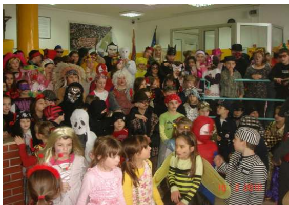
Fašnik u školi - ljudi i nezaboravni ples mališana.

Pod raznolikim šarenilom maštovitih maski dana 16.02.2010. razredna nastava održala je ples. Našlo se tu princeza, vještica, duhova, pčelica, kuhara, majmuna, zatvorenika, klauna i drugih neobičnih gostiju.