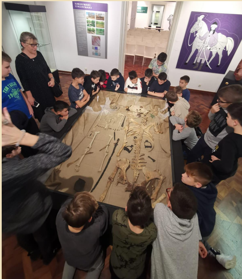
Fotografija iz ptičje perspektive- napeti trenutci upoznavanja zemnih ostataka eksponata

Najzanimljiviji trenuci sigurno su za većinu učenika bili susret s kosturima vojnika i njihovih konja, kao i radionice Izrada nakita i Obrada metala. Na njima su učenici dali oduška svojoj mašti i kreativnosti i izradili lijepe komade nakita i sličica na bakrenom limu koje su ponijeli svojim kućama kao uspomenu na ovu izložbu.