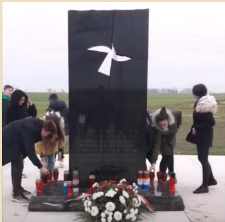
Paljenje svijeća za sve vukovarske heroje

https://www.youtube.com/watch?v=a8a2Zyr0TVM