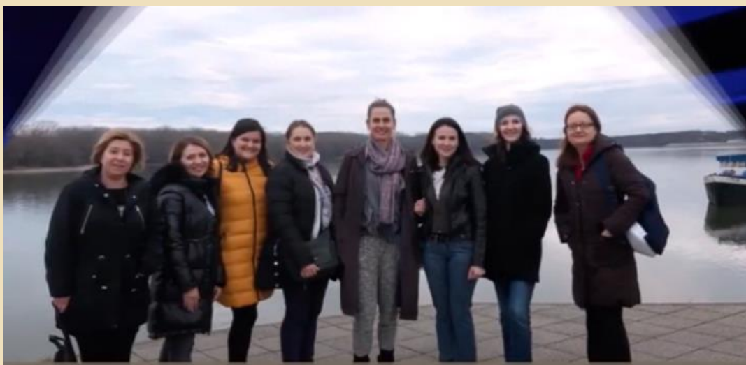
Razrednice i pedagoška služba